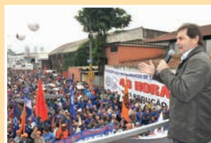
Paulinho da Força é reeleito deputado federal e reafirma seu projeto de continuar a luta no Congresso Nacional pelos direitos da classe trabalhadora