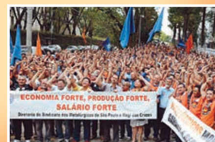
As campanhas salariais de 2014 garantiram aumento real e avanços