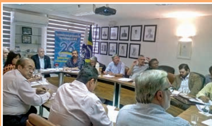
Diretoria Executiva da Confederação Nacional dos Trabalhadores Metalúrgicos (CNTM) reúne-se na sede em Brasília para avaliação da conjuntura econômica e ações em defesa da categoria