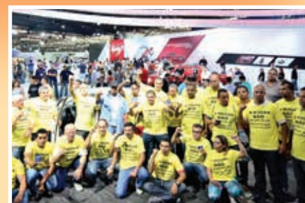
Protesto de trabalhadores da Nissan dos EUA no Salão do Automóvel, em São Paulo, em defesa dos direitos sindicais