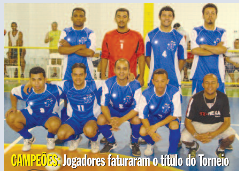
CAMPEÕES: Jogadores faturaram o título do Torneio