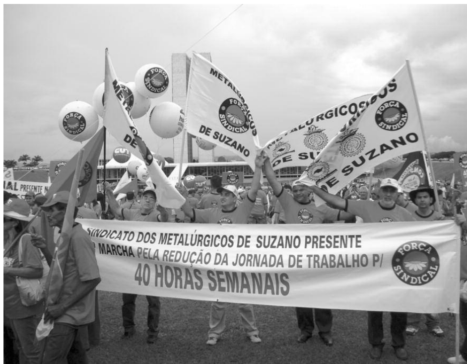
EM BRASÍLIA: Diretores suzanenses participaram do ato político realizado na frente do Congresso Nacional

Os manifestantes defenderam a redução da jornada semanal de trabalho de 44 para 40 horas semanais, sem diminuição dos salários. O grupo caminhou pela Capital Federal e se concentrou na frente do Congresso Nacional, onde foi realizado um ato político. A proposta visa criar novos empregos e será analisada pelos parlamentares antes de ser votada.