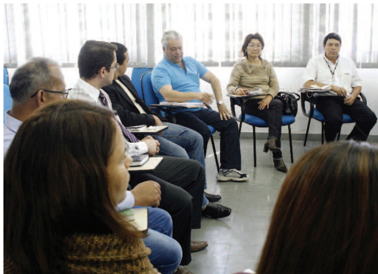
NEGOCIAÇÕES: Sindicato dos Metalúrgicos durante uma das várias reuniões deste ano

Foram dezenas de reuniões e, mesmo antecipando o início da nossa campanha, não conseguimos acelerar o fechamento devido a esta choradeira dos patrões. Porém, com a prerrogativa de utilizarmos a única e eficaz forma de pressão que temos, chamada de "direito de greve", conseguimos finalizar nossa campanha com sucesso.