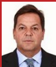
SERGIO ZVEITER (PMDB)