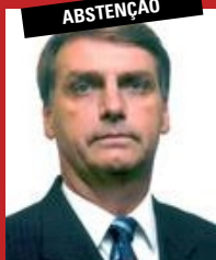
JAIR BOLSONARO (PSC)