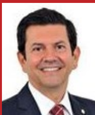
OTAVIO LEITE (PSDB)