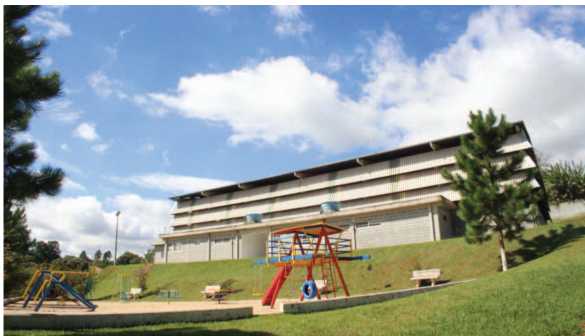
SÍTIO: Trabalhadores metalúrgicos estão convidados a participarem da assembléia do próximo dia 22 de agosto, que terá início às 10h