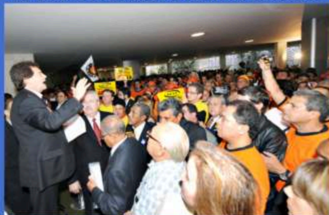
Sindicalistas de todo o Brasil foram até Brasília cobrar do governo a jornada de 40h e outras melhorias para os trabalhadores.

cedo, os já aposentados terão aumento real acima da inflação e uma série de outros benefícios. Este não é o acordo desejado, queremos correção igual ao do salário mínimo. Continuaremos na luta para conseguir as recomposições e defasagens do benefício dos aposentados.