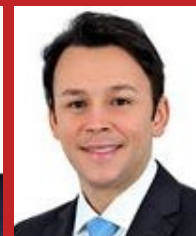
MÁRIO NEGROMONTE JR. (PP)