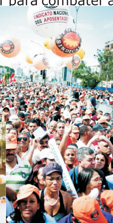
80 mil trabalhadores tomaram as ruas de São Paulo para reivindicar a aprovação da pauta trabalhista