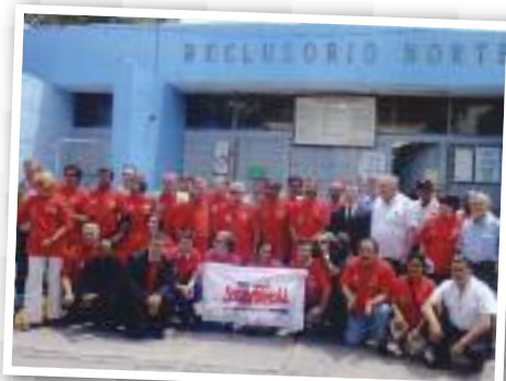
NO MÉXICO: Sindicalistas de vários países