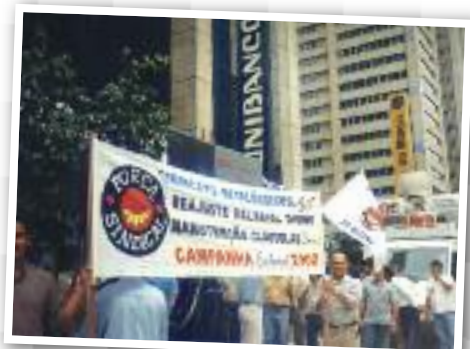
EM SP: Diretoria prestigia ato público