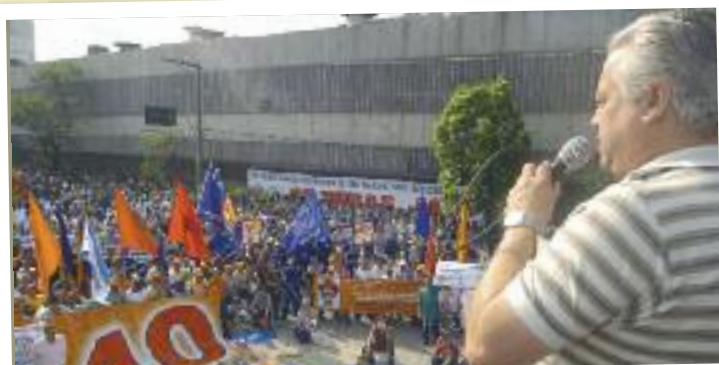
Manifestação em defesa da redução da jornada para 40h