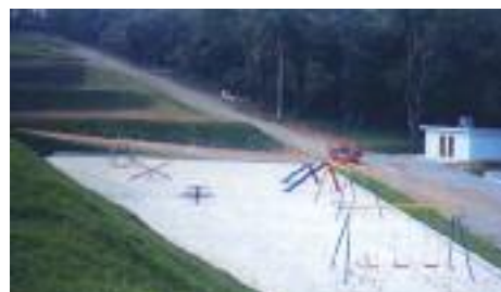
PLAYGROUND: Conquista para crianças