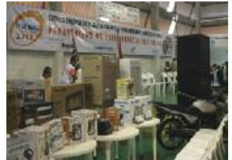
TRABALHADOR: Realizada em maio, festa conta com o aguardado sorteio de prêmios