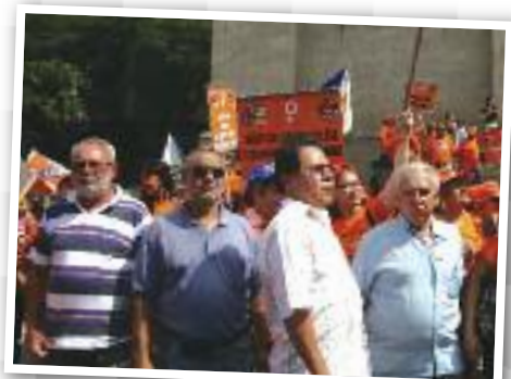
DIA DA MULHER: Apoio às trabalhadoras