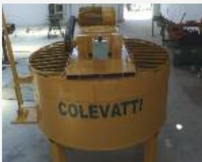
MISTURADOR 700 litros e fácil manejo