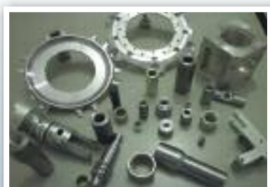
Exemplos de usinagem