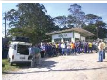
ULIANA: Assembleia com funcionários