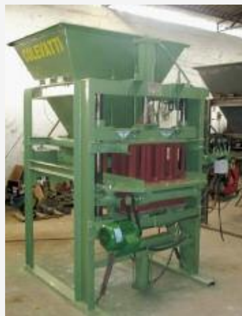
PRODUÇÃO DE BLOCOS Robusta e silenciosa

Equipamentos para construção civil com qualidade e durabilidade , projetados para produção em escala industrial . Máquinas reforçadas, fáceis de trabalhar e com baixa manutenção. A COLEVATTI possui experiência de 20 anos no setor e está há 12 anos no mesmo endereço.