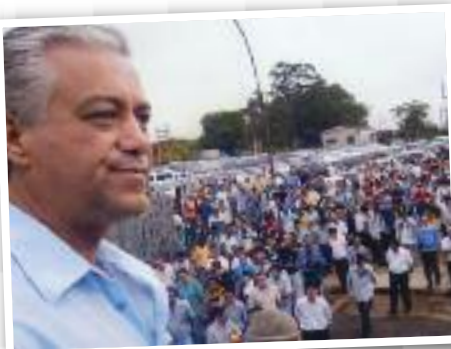
PARCERIA: Ao lado dos companheiros