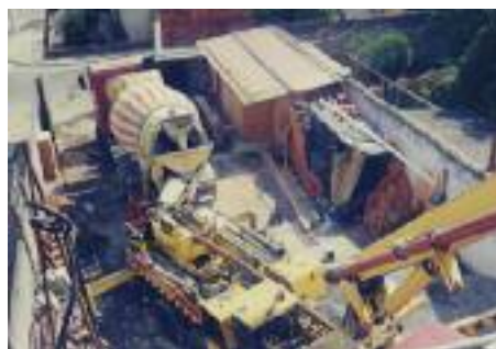
BASE: Obra exigiu maquinário pesado