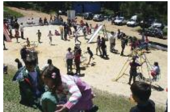
CRIANÇAS: Já outubro, comemoração proporciona lazer aos filhos dos trabalhadores