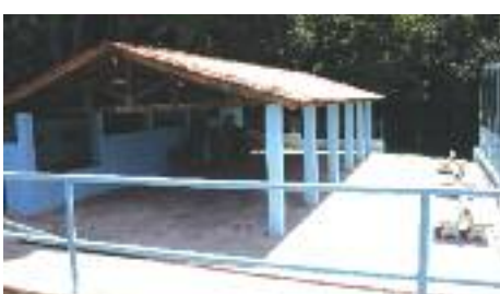
CHURRASQUEIRA: Espaço para eventos