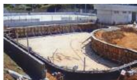
PISCINA: Obra valorizou a propriedade