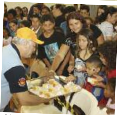
Distribuição de bolo durante a tradicional Festa das Crianças