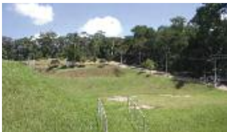
INÍCIO: Não havia benfeitorias na área