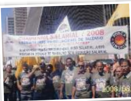
NA FIESP: Pauta entregue aos patrões