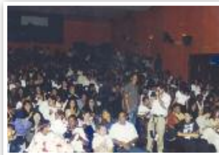
FORMATURA: Diplomação dos alunos