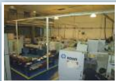
Parque de máquinas

Atendendo aos mais altos padrões de qualidade exigidos por nossos clientes e parceiros e completando 10 anos no mercado, conquistamos as normas de qualidade ISO9001:2008 e de processo VDA6.3. Assim, escrevemos nossa história em Suzano ao lado de nossos colaboradores, clientes e amigos. Agradecemos e parabenizamos o Sindicato dos Metalúrgicos pelos 21 anos de fundação