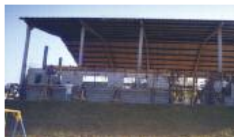
PRÉ-MOLDADO: Estrutura tomava forma