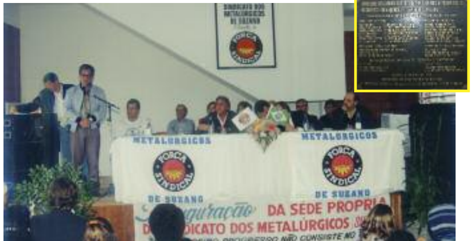
INAUGURAÇÃO: Cerimônia ocorreu em 1995; no destaque, placa com a Diretoria

O prédio foi feito com blocos de alta resistência, comprados em Itu e que facilitam a manutenção. No térreo há um salão onde acontecem as assembleias com os trabalhadores, além de pequenas recepções. No primeiro andar ficam a recepção, o setor administrativo e as salas dos diretores. Já no segundo andar, estão as salas de atendimento odontológico e jurídico, além de um mais uma área para reuniões.