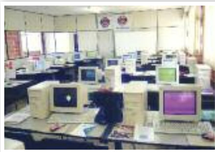
INFORMÁTICA: Sala de computadores

Além disso, a sede também recebeu diversas palestras sobre temas de interesse dos trabalhadores, como o Estatuto do Idoso, direitos dos aposentados, fator previdenciário e CLT, entre outros.