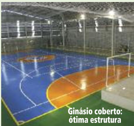
Ginásio coberto: ótima estrutura

PISCINAS ADULTA E INFANTIL: Inauguradas em 2010, as duas piscinas funcionam às sextas, sábados, domingos e feriados, das 10h às 18h