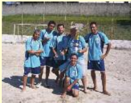
FESTIVAIS: Alegria e troféus no Sítio