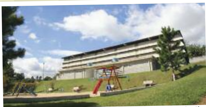
Sítio: patrimônio dos metalúrgicos que evolui a cada dia