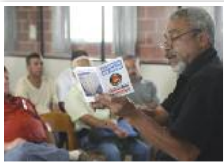
IDOSOS: Palestra detalha o estatuto