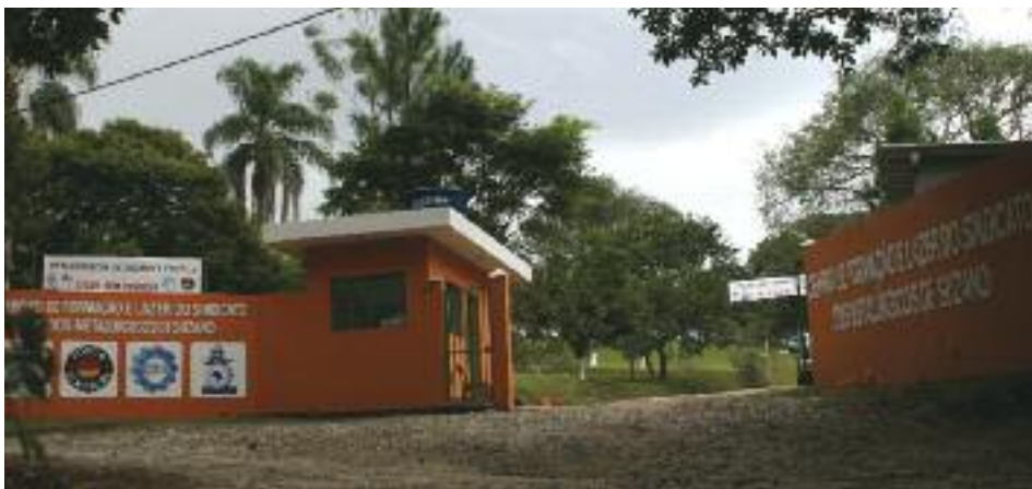
SEDE ATUAL: Com nova pintura e bem cuidado, Sítio oferece lazer aos metalúrgicos