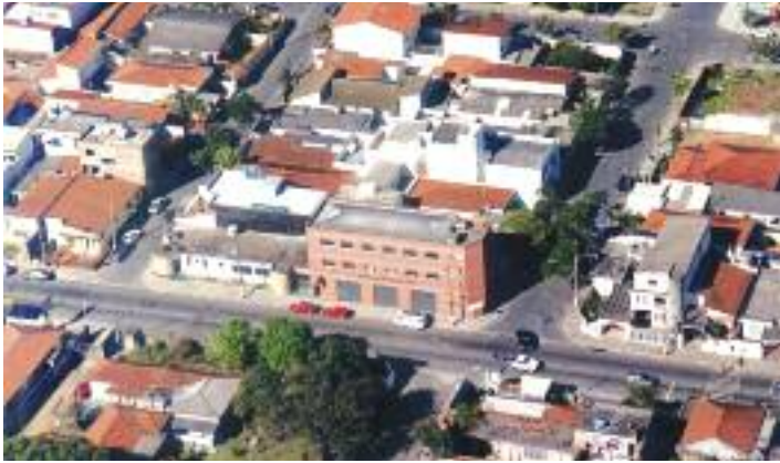
LOCALIZAÇÃO: Sede fica em área privilegiada, bem no Centro