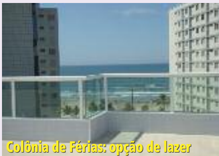
Colônia de Férias: opção de lazer