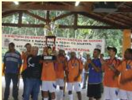
TORNEIOS: Komatsu levou o tri em 2012