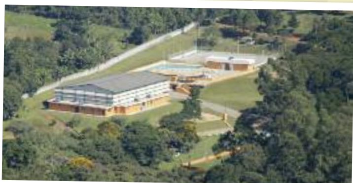
Vista aérea do Sítio do Sindicato, no Jardim Samambaia