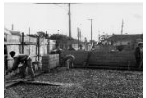
PAREDES: Construção começa a surgir