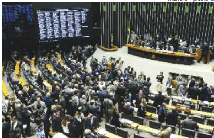
Gustavo Lima / Agência Câmara

BRASÍLIA: Trabalhadores têm o desafio de elevar sua representação