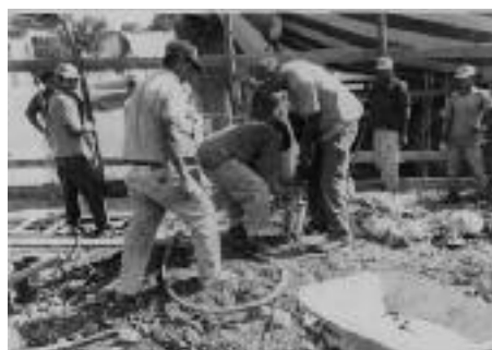
INÍCIO: Operários preparam o terreno