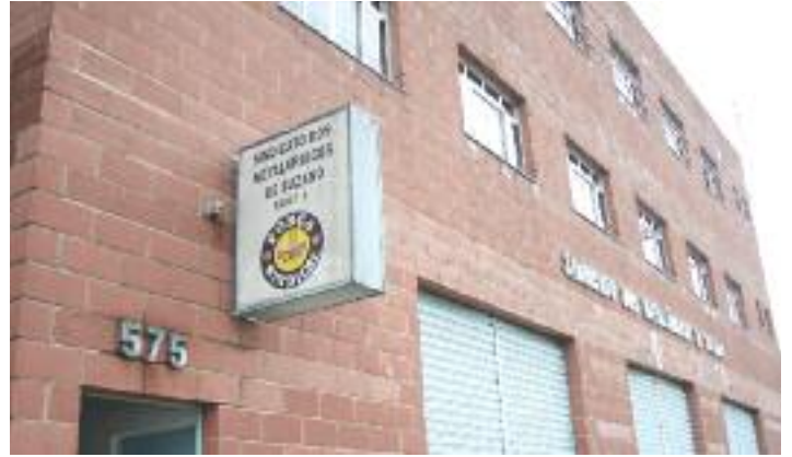
PRÉDIO: Ótima estrutura, com dois andares e salão no térreo