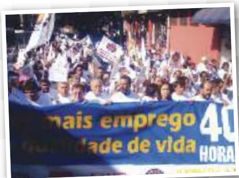
40 horas: Diretores participam de ato

» Imagens mostram compromisso histórico do Sindicato em assembleias, atos públicos e campanhas salariais