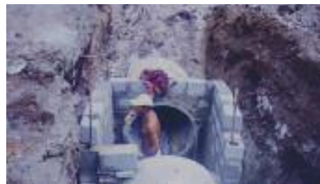
1ª OBRA: Galeria de água foi construída