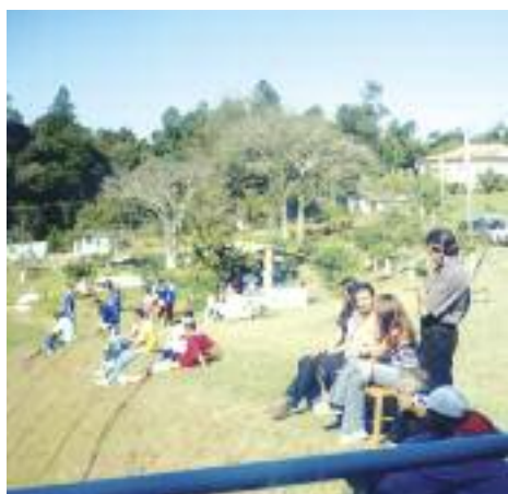
LAZER: Sítio já formado na década de 30