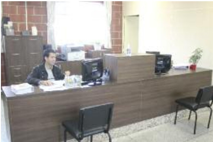
RECEPÇÃO: Serviços são solicitados e agendados com rapidez