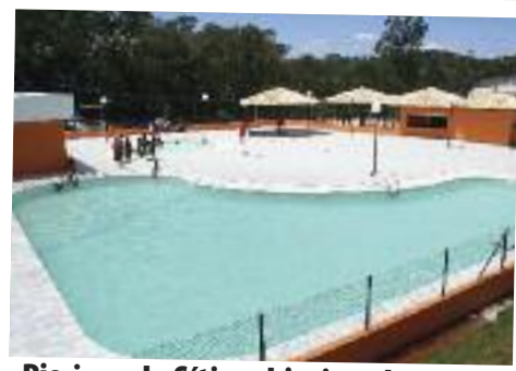
Piscinas do Sítio: objetivo alcançado