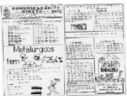
Julho de 1991: primeira edição do boletim Comunicação Direta