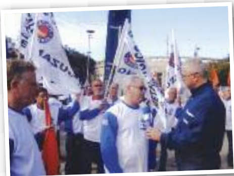
ENTREVISTA: Benites fala no Pacaembu