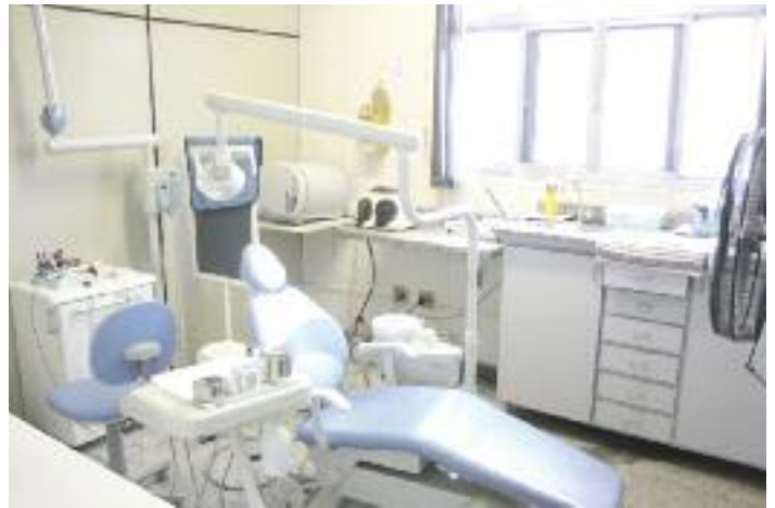
DENTISTA: Consultório moderno funciona no segundo andar