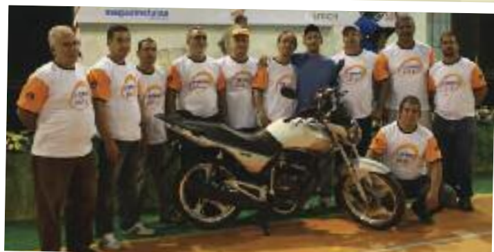
Sorteio da Moto zero quilômetro na Festa do Trabalhador