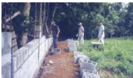
MURO: Próxima etapa foi cercar o Sítio