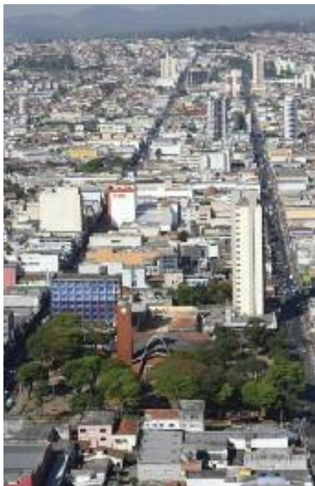
SUZANO: Crescimento rápido e contínuo

A partir da emancipação, em 1949, Suzano rapidamente se desenvolveu. Nas décadas de 60 e 70, a cidade teve rápido crescimento industrial, a partir de uma pioneira parceria com indústrias japonesas que se instalaram na cidade graças à doação de