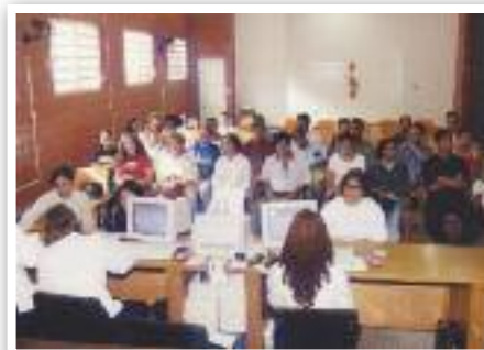
APOIO: Centro voltado ao trabalhador