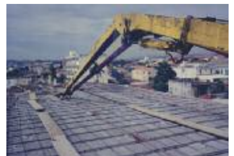
SUBINDO: Laje pronta para o 2º andar