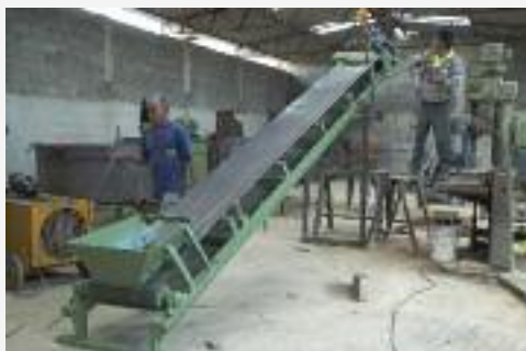
ESTEIRA Reforçada e com grande durabilidade