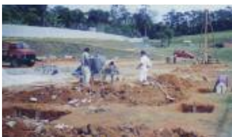
GINÁSIO: Operários preparam o alicerce