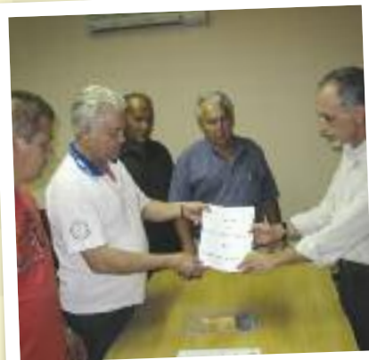
Entrega das reivindicações da categoria aos empresários

EDIÇÃO COMEMORATIVA • JULHO DE 2012 • DISTRIBUIÇÃO GRATUITA