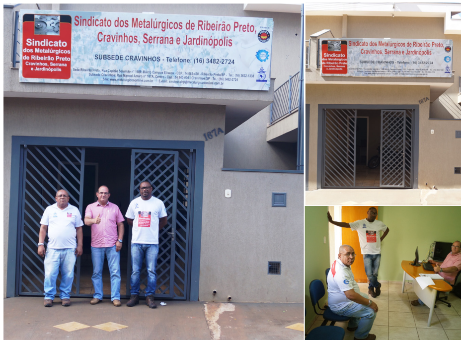
Fachada da Subsede Cravinhos onde serão oferecidos atendimentos para os trabalhadores, localizada na Rua Manoel Amaro n° 167A no município de Cravinhos-SP

O Sindicato dos Metalúrgicos de Ribeirão Preto, Cravinhos, Serrana e Jardinópolis colocou em operação no dia 14 de abril de 2016 a subsede da entidade no município de Cravinhos.