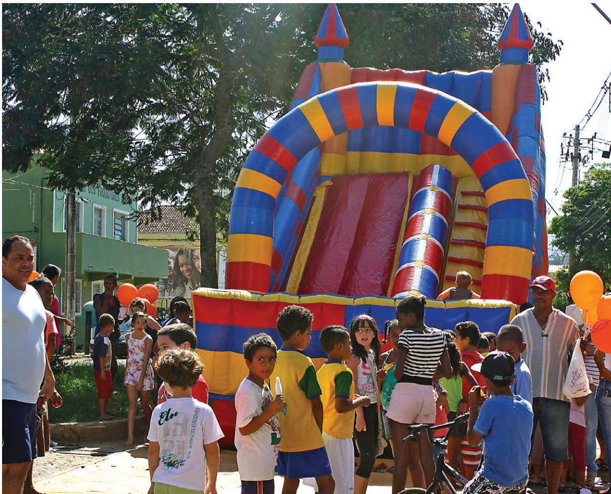
Crianças se divertiram de graça com os brinquedos montados pelo Sindicato.