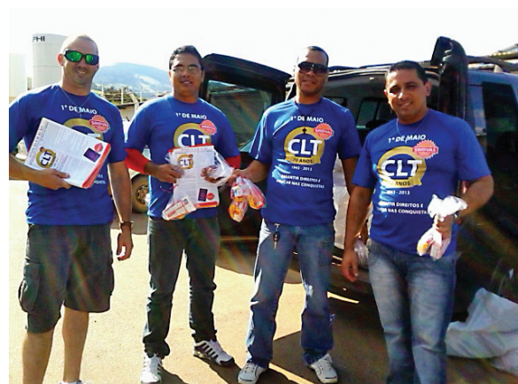
Diretores do SINDVAS panfletaram sobre os 70 Anos da CLT e distribuíram brindes aos trabalhadores.