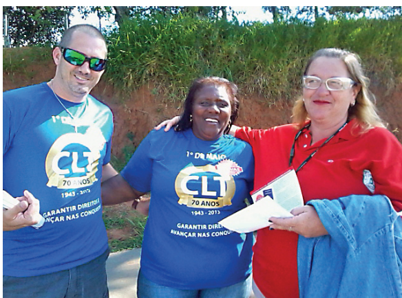
Diretoria do Sindicato cumprimentou os trabalhadores pelo Primeiro de Maio.