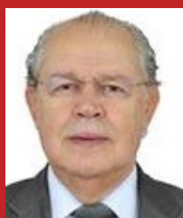
LUIZ CARLOS HAULY (PSDB)