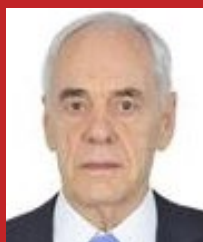
REINHOLD STEPHANES (PSD)