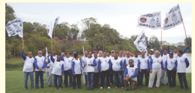
PRESEÇA: Diretoria e trabalhadores participaram do ato na Capital