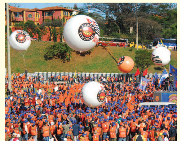
UNIÃO: Mobilização em SP demonstrou a força dos trabalhadores