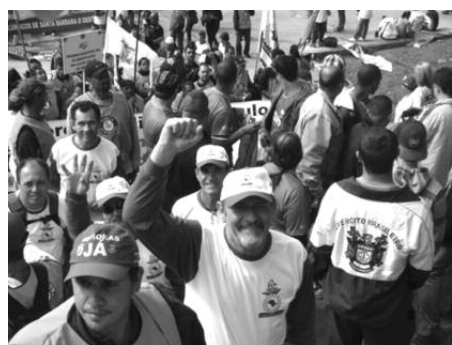
MAGRÃO: Presidente da Federação reforçou o ato