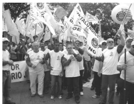
SUZANO: Diretores participaram da manifestação