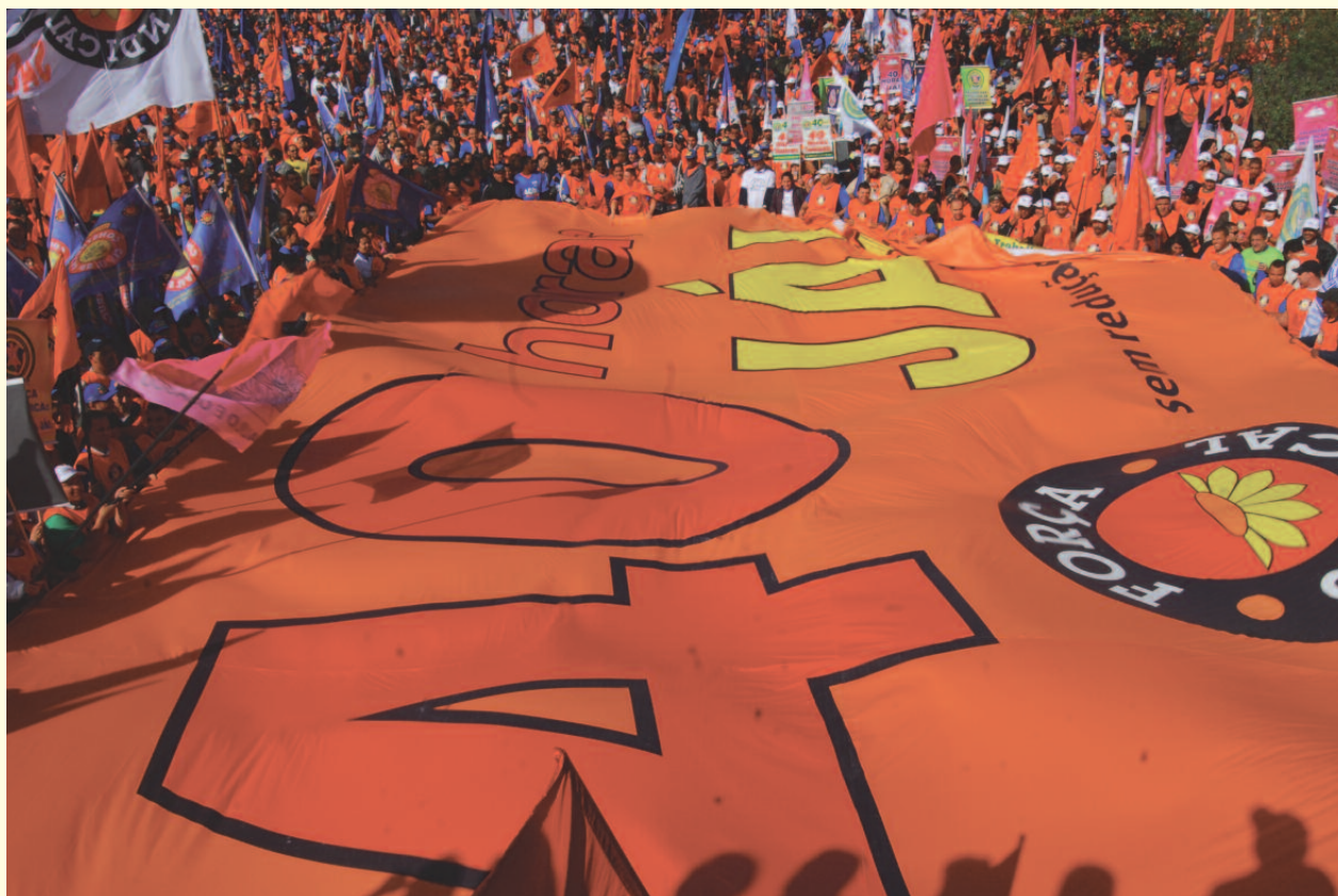
DIREITOS: Manifestantes apresentaram suas bandeiras de luta, como a redução da jornada de trabalho se 44h para 40h semanais, sem perda salarial

RESPONSÁVEL: A DIRETORIA ANO XX NÚMERO 225 AGOSTO DE 2011