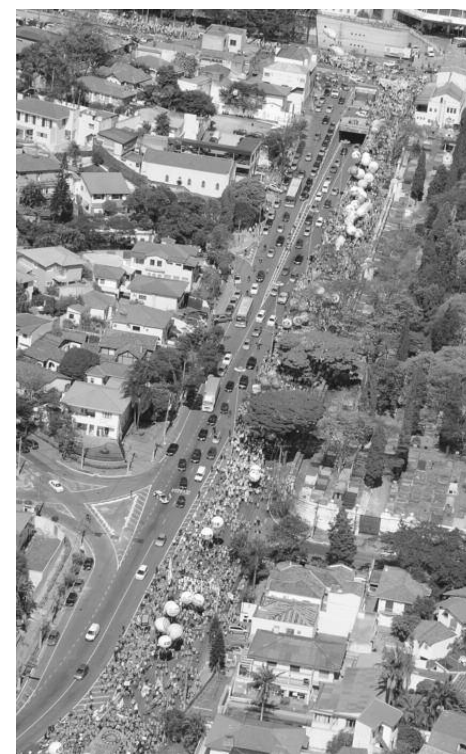
MARCHA: Multidão foi do Pacaembu até a Assembleia