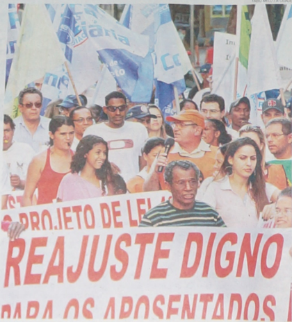
BARULHO Manifestantes percorreram o Centro e usaram carro de som para divulgação