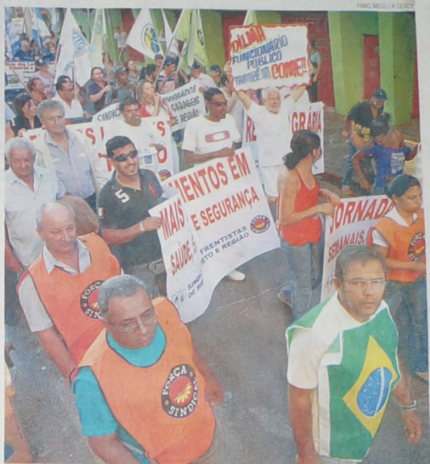
DIVERSO Passeata foi composta por trabalhadores de várias categorias, como frentistas