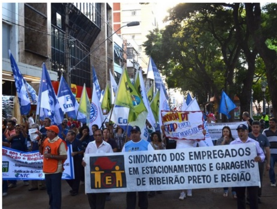
Sindicalistas caminham pelo centro de Ribeirão Preto durante manifestação

Cerca de 150 trabalhadores participaram na tarde desta quinta-feira (11) de uma passeata