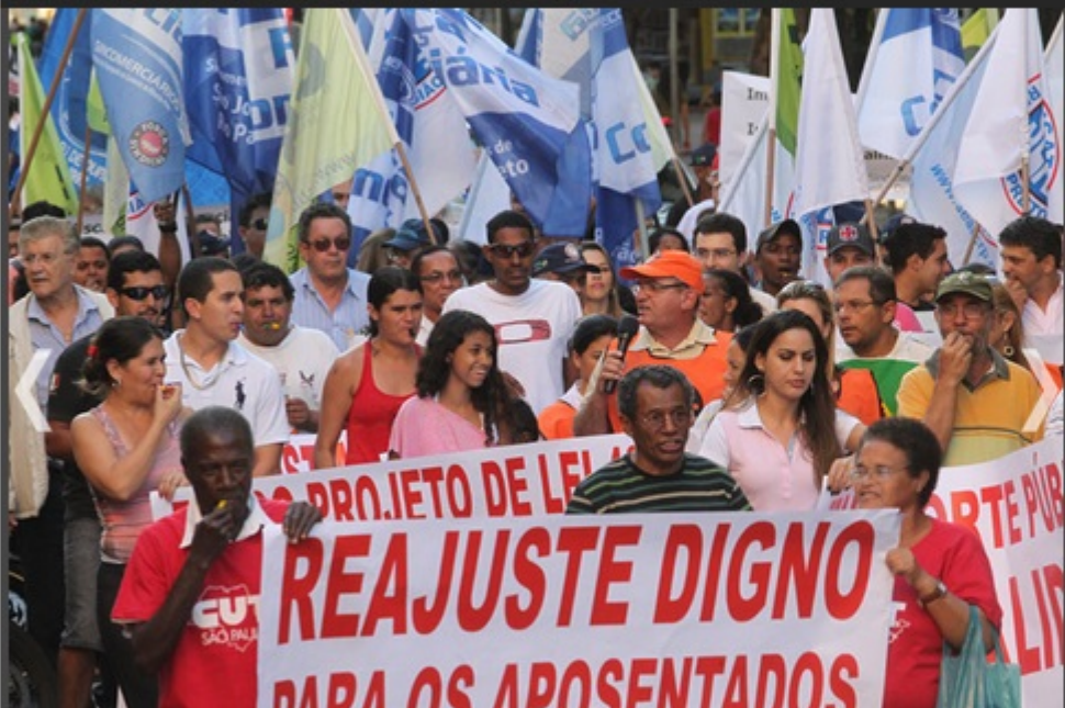
Aproximadamente 200 pessoas ligadas a sindicatos de trabalhadores participaram do ato