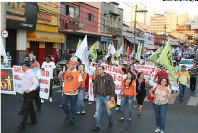
Centrais sindicais fazem passeata no centro Ribeirão Preto

O ato reuniu cerca de 150 pessoas, segundo a PM --a Força Sindical falou em 400.