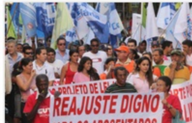
Manifestantes percorreram o Centro e usaram carro de som para divulgação.

Cerca de 200 pessoas participaram na tarde desta quinta-feira (11), em Ribeirão Preto, do "Dia Nacional de Luta", evento convocado por diversas centrais sindicais que ocorreu simultaneamente em várias cidades do país.