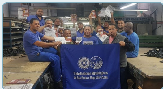
MULTI JURAS e ROYAL Josias