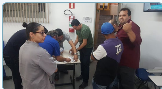
DIEHL DO BRASIL Jamanta