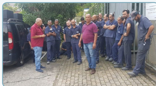
VOESTALPINE BOHLER Assistentes do Carlão