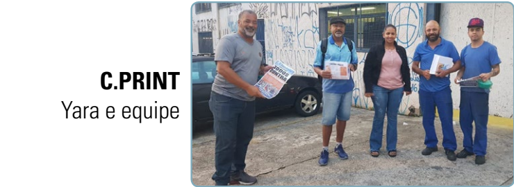
C.PRINT Yara e equipe