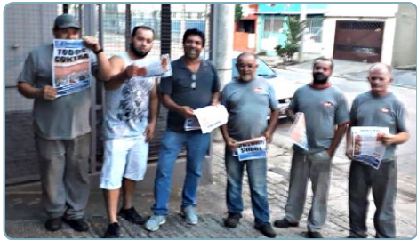
GP CABOS Equipe Alsira