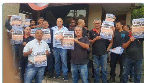
STI Equipe Carlão