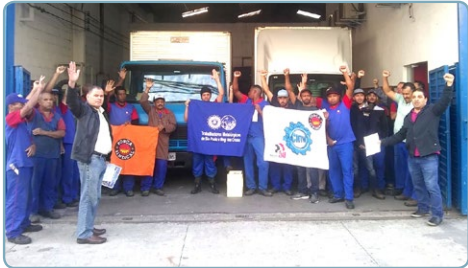
CROMIT Equipe Teco