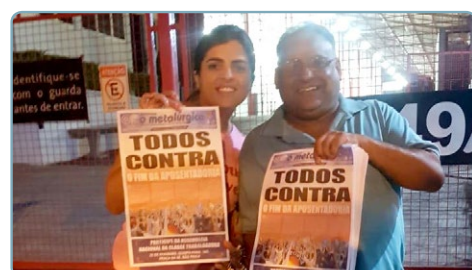
AMPLICABOS Equipe Érlon