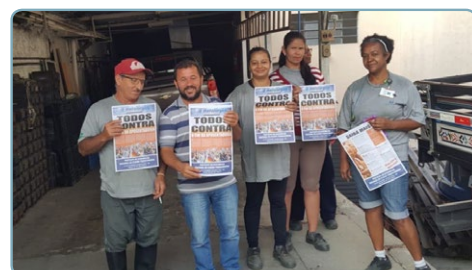
VENTIL MANETTI Equipe Maloca