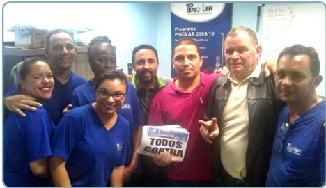
PINOMAR Equipe Teco