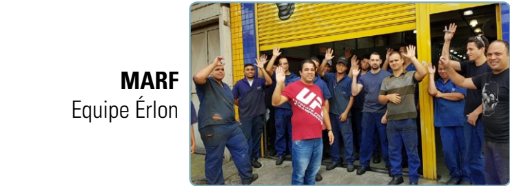
MARF Equipe Érlon