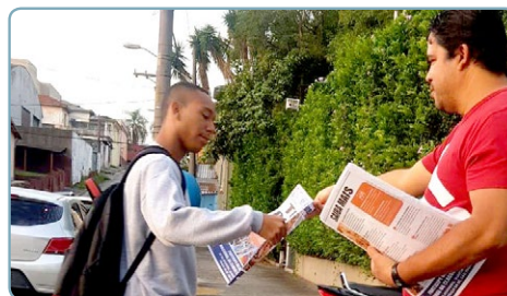
PHB Equipe Érlon