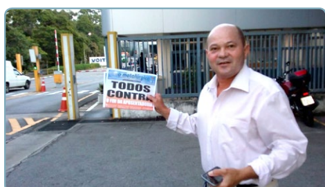
VOITH Equipe Teco