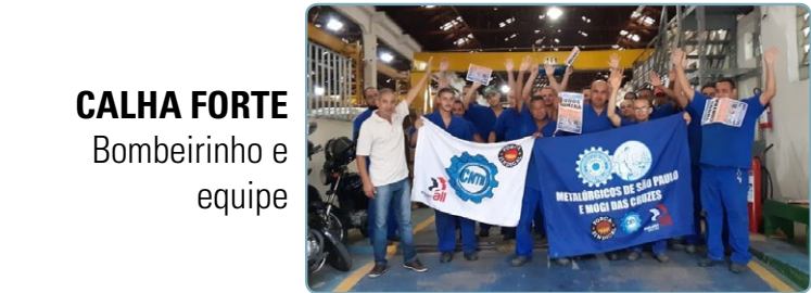
CALHA FORTE Bombeirinho e equipe