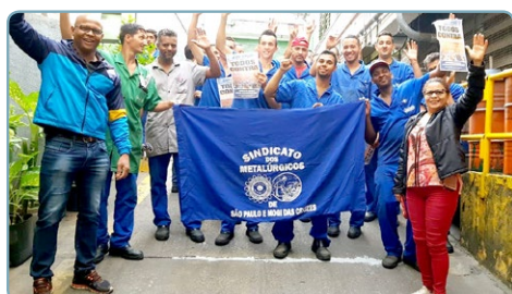
ARO ESTAMPARIA Sonete e equipe