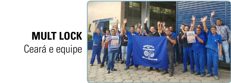
MULT LOCK Ceará e equipe