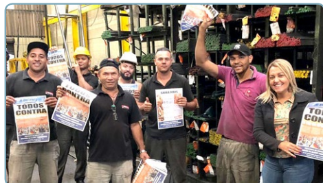
TRANAL Alsira e equipe