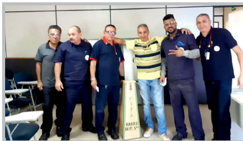
ARATELL Bombeirinho e equipe, com eleição da CIPA