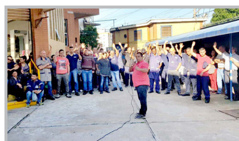
PACRI Jesus e equipe