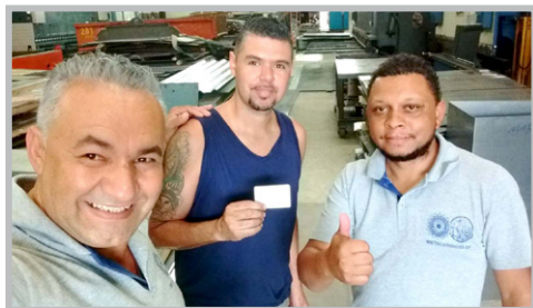
METALCORTE Equipe Chico Pança