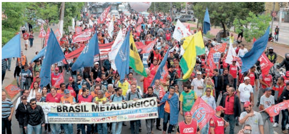
Passeata de unidade e protesto