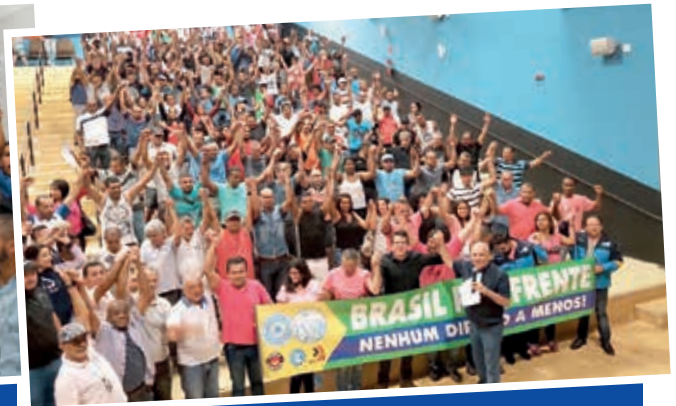
ZONA LESTE (Itaquera)