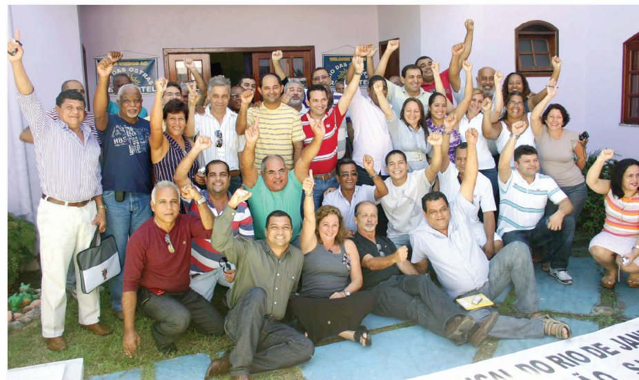
Tanto os participantes do Módulo I, em Rio das Ostras...