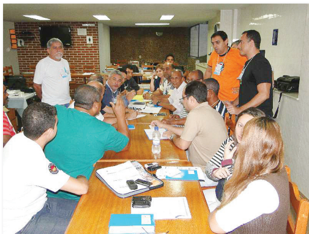
A simulação de uma negociação foi um dos pontos altos do encontro em Santo Aleixo