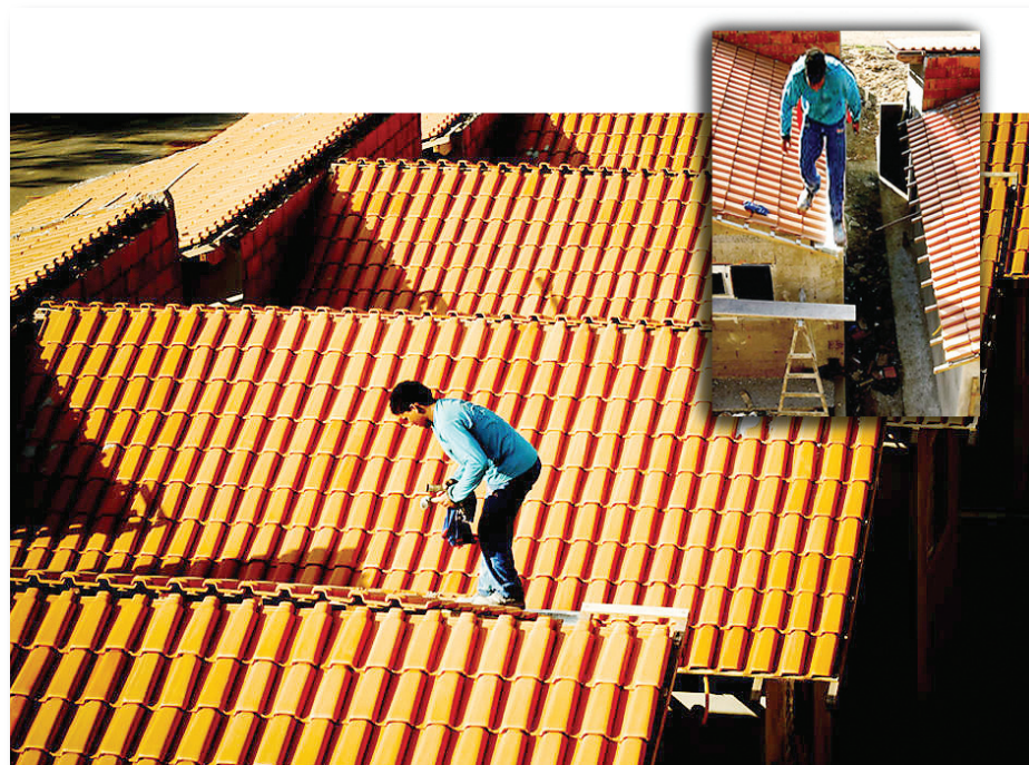
E a vida do trabalhador? Quanto vale?

A maior parte das denúncias apuradas pelos órgãos competentes vêm do interior de São Paulo, mas a Força Sindical RJ acredita que a situação se repete por todo o país. Trabalhando