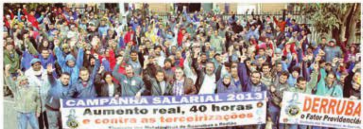
NA BASE - Diretores do Sindicato e trabalhadores de Mariporá, em Guarulhos, mobilizados na campanha salarial

Os metalúrgicos têm o que comemorar no ano em que nosso Sindicato completou meio século.