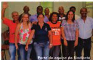
Parte do equipe do Sindicato

A eleição, coordenada pela Federação dos Metalúrgicos do Estado de Minas Gerais, aconteceu nos dias 22 e 23 de janeiro.