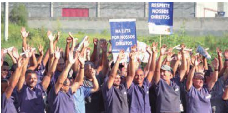
Organizados pelo Sindicato, metalúrgicos da Novex e da Darvo, de Santana de Parnaíba, cobram plano de cargos, vale alimentação em dia e melhorias na refeição fornecida