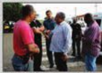
Direção do Sindicato conversando com os bombeiros que queriam destruir a avenida