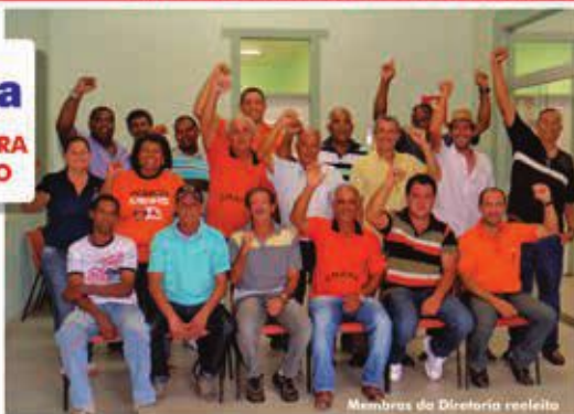
Membras da Diretoria reeleita