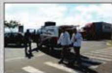
"Avenida trancada e o conflito é formal"