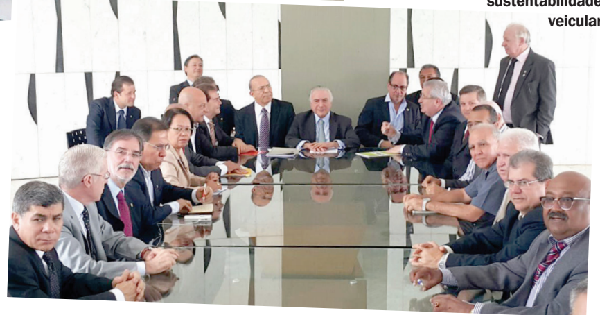
Vice-presidente da República saudou a proposta de sustentabilidade veicular