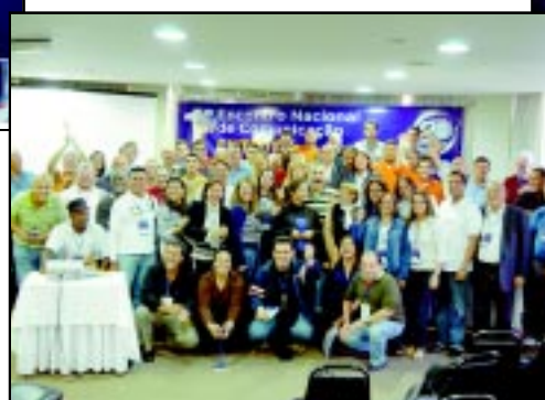
PARTICIPANTES DO EVENTO