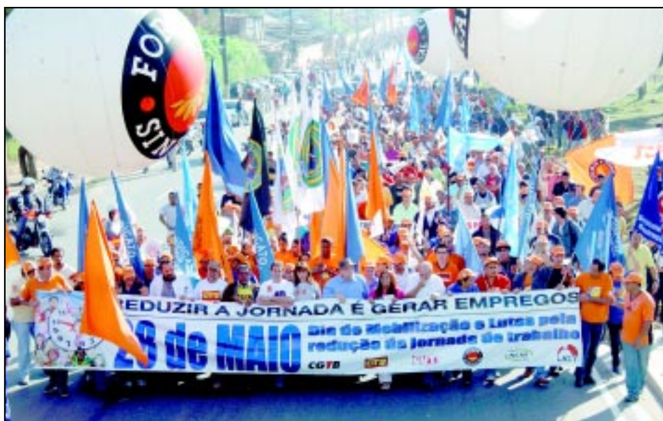
Dia Nacional de Luta pelas 40 horas

Já no dia 3 de junho, em Brasília, entregamos ao Congresso Nacional os abaixo-assinados com as mais de 1,5 milhão de assinaturas coletadas pelo movimento sindical em apoio ao projeto de lei que prevê a redução constitucional da jornada de trabalho no País.