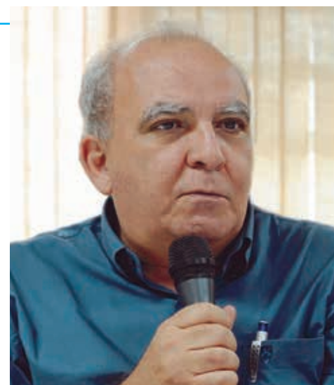
Miguel Torres Presidente da CNTM e Força Sindical

Exigimos a queda da taxa Selic de juros, estamos mobilizados no Congresso Nacional, em Brasília, para derrotar as MPs 664 e 665, e seguimos firmes com nossa Pauta Trabalhista (que pede redução da jornada de trabalho, fim do fator previdenciário, fim das demissões imotivadas, valorização do salário mínimo e das aposentadorias