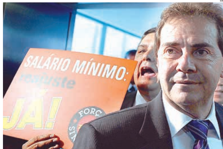
DEPUTADO FEDERAL PAULINHO DA FORÇA: GRANDE LÍDER DA CLASSE TRABALHADORA NO CONGRESSO

A Câmara dos Deputados aprovou o projeto do deputado federal Paulinho da Força (Solidariedade) que mantém a política de valorização do salário mínimo até 2019, e garante reajuste acima da inflação.