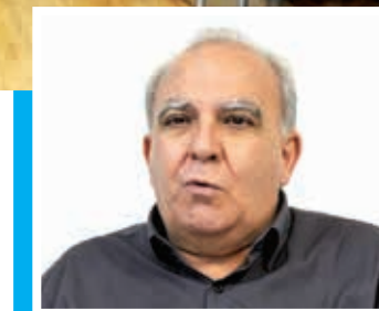
Miguel Torres Presidente da CNTM e da Força Sindical

Nossos dirigentes metalúrgicos são unânimes em criticar a falta de diálogo do governo federal com o movimento sindical, a alta dos juros, a desindustrialização, a alta rotatividade da mão de obra, as desigualdades regionais de salários no País, as empresas que não respeitam a saúde e a segurança do trabalhador e a falta de investimentos na indústria e na qualificação profissional.