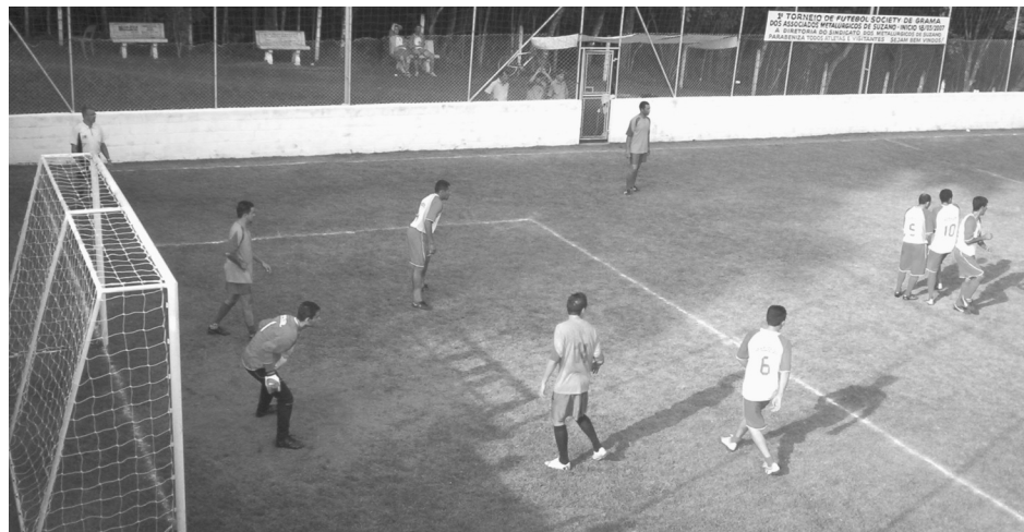
SOCIETY: Jogos serão disputados no campo de grama do Sítio, a partir do dia 25 de agosto