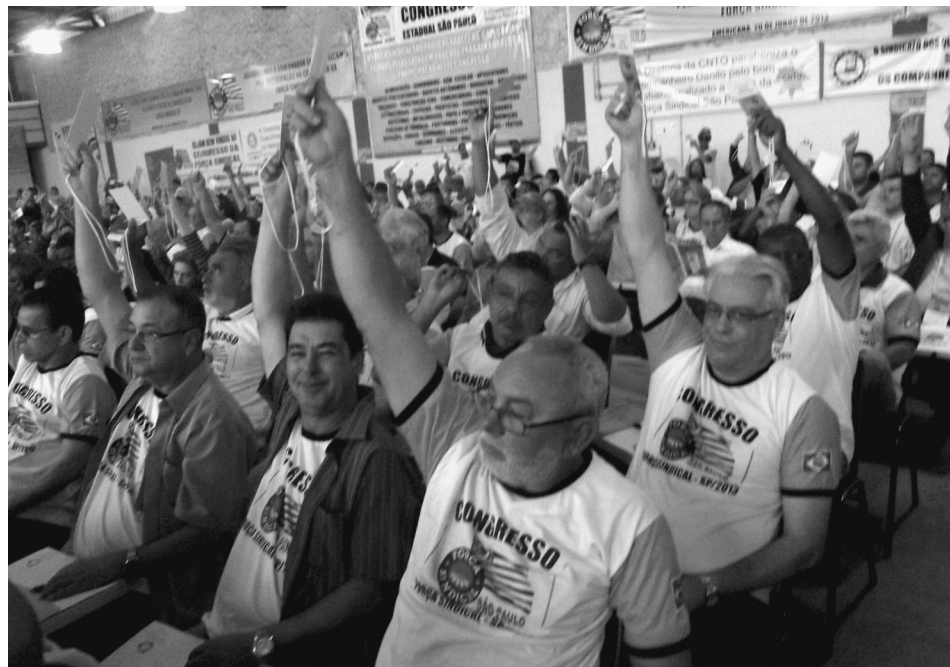
SUZANO: Diretores participaram do Congresso e defenderam as propostas apresentadas