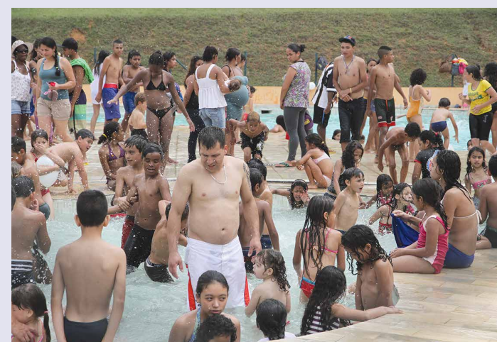
MOVIMENTO: Piscinas valorizam o Sítio e agradam ao público

Como o domingo foi quente, as piscinas adulta e infantil receberam um grande número de pessoas. Adultos, jovens e crianças aproveitaram o espaço para nadar e se refrescar. Os quiosques instalados na área foram utilizados pelas famílias para descanso, enquanto as cadeiras eram usadas por pessoas que pegavam sol. As piscinas recebem manutenção contínua e possuem todos os equipamentos de segurança, o que assegura um lazer com tranquilidade para os trabalhadores e seus familiares.