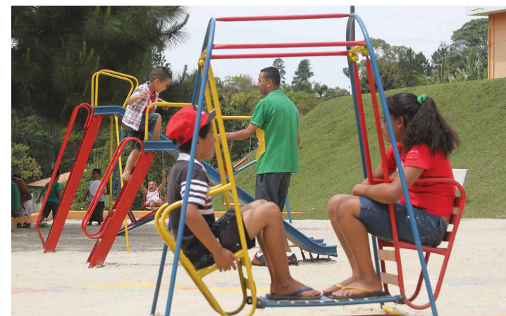
PLAYGROUND: Crianças se divertiram e fizeram novas amigas