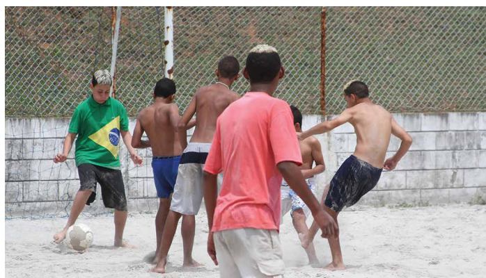
FUTEBOL: Garotos aproveitaram e jogaram no campo de areia

Os diretores ficaram posicionados em diversos pontos do Sítio, desde a entrada até os locais mais afastados, orientando as pessoas e garantindo o clima de total segurança para as famílias que foram à festa.