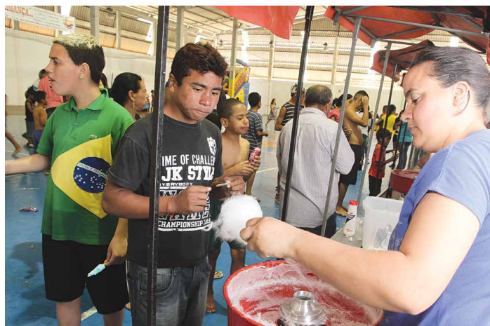
ALGODÃO DOCE: Tradicional, fez a alegria de todos no Ginásio