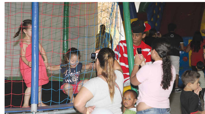
BRINQUEDOS: Criançada se divertiu muito, com total segurança