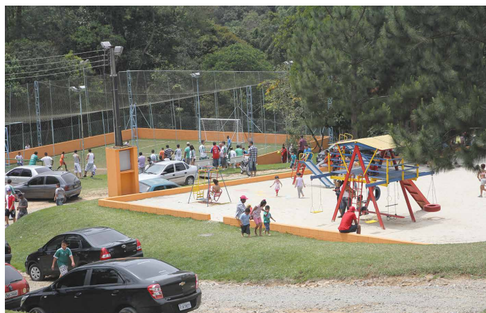
SÍTIO: Famílias aproveitaram a estrutura e o espaço do Sítio