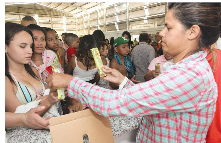
SORVETE: Novidade deste ano foi distribuída e refrescou o calor

Do lado externo do Sítio, as famílias aproveitaram o bom tempo do domingo nas churrasqueiras, no playground, no campo de areia, nas piscinas e na área verde. Já no Ginásio, as crianças se divertiram com refrigerante, pipoca, sorvete e algodão doce, além dos tradicionais brinquedos infláveis.