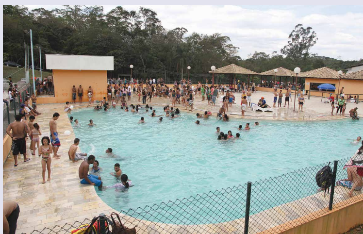
CALOR: Adultos e crianças aproveitaram para brincar e se refrescar

Como o domingo foi quente, as piscinas adulta e infantil receberam um grande número de pessoas. Adultos, jovens e crianças aproveitaram o espaço para nadar e se refrescar. Os quiosques instalados na área foram utilizados pelas famílias para descanso, enquanto as cadeiras eram usadas por pessoas que pegavam sol. As piscinas recebem manutenção contínua e possuem todos os equipamentos de segurança, o que assegura um lazer com tranquilidade para os trabalhadores e seus familiares.