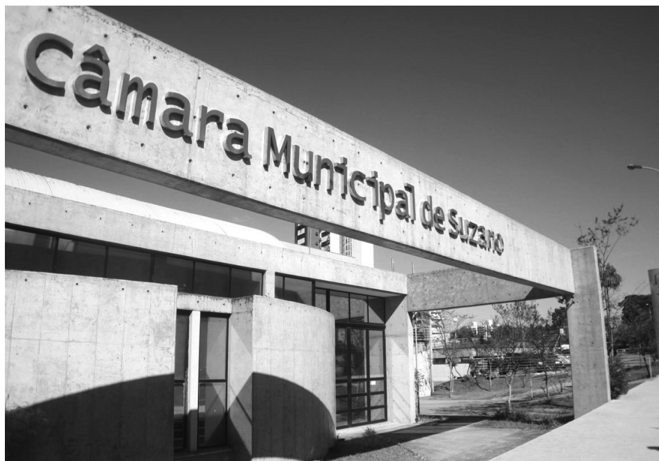
CÂMARA: Evento de premiação será realizado no dia 11 de dezembro, a partir das 19h

O Sítio do Sindicato é outra alternativa de lazer muito utilizada e elogiada