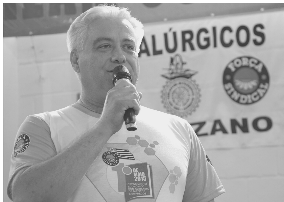
BENITES: Presidente participou das negociações e destacou o bom resultado final